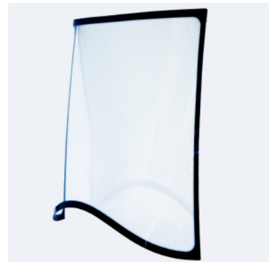
Muster gebogene Scheibe mit Siebdruck